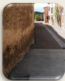
Rue des Jardins

Les travaux de voiries et du réseau pluvial ont pris fin dans toute la commune fin mars,