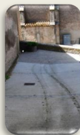
Impasse du clocher