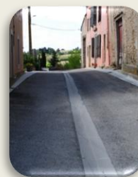
Rue Louis Chiffre